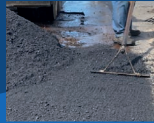
11. Drenagem e pavimentação da rua Vera Cruz - Nova Palestina (Em execução)