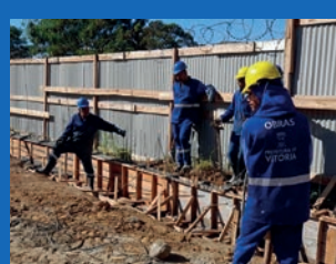
42. Construção da Emef Ronaldo Soares - Resistência (Em execução)