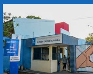
40. Reforma e instalações elétricas da Emef Rita de Cássia Silva Oliveira - Resistência (Concluída)