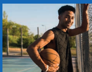
33. Reforma da quadra - Conquista (Em execução)