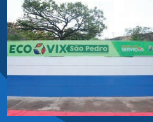
20. Instalação do Ecovix São Pedro