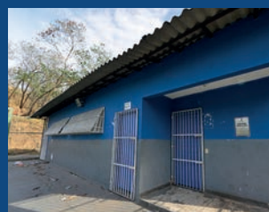
37. Reforma dos vestiários do campo - Resistência