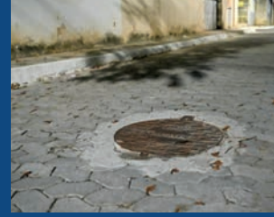
10. Drenagem e pavimentação da rua São Tiago - Nova Palestina (Concluída)