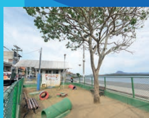
07. Construção Pracão da praça Dom João Batista (Em execução)