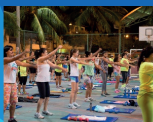
06. Cobertura da quadra da praça de São Pedro (Obra projetada)