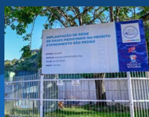
39. Implantação da rede de gases medicinais do PA de São Pedro (Em execução)