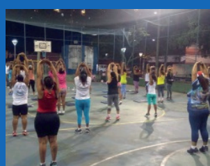
32. Reforma da quadra - Comdusa (Em execução)