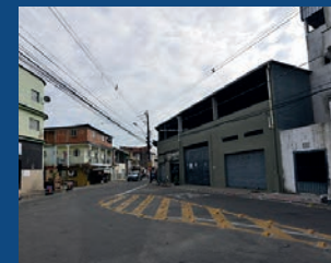
19. Instalação de sinalização viária e dos tachões da rua da Coragem