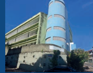
16. Implantação do Tempo Integral no Emef José Lemos de Miranda