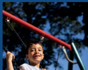
36. Reforma do playground - Conquista