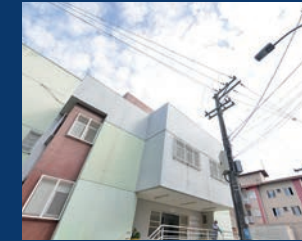
22. Nova iluminação do CEU da Grande São Pedro