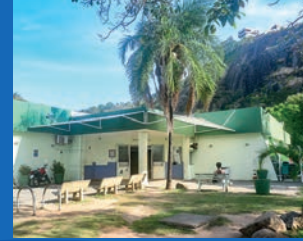
21. Reforço das escadas médicas do PA de São Pedro