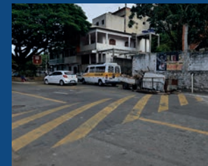
18. Instalação de quebra-molas em frente ao campo do Racing