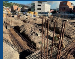
09. Construção do Cmei Geisla da Cruz Militão (Em execução)