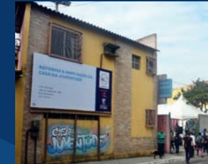
23. Reforma e ampliação da Casa da Juventude de São Pedro (Em execução)