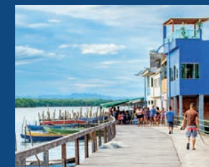
25. Projeto para a utilização das águas das nascentes - Ilha das Caieiras e Nova Palestina (Em execução)