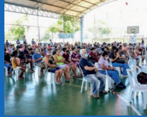
13. Entrega de escrituras - Santo André e São José (1319 famílias beneficiadas)