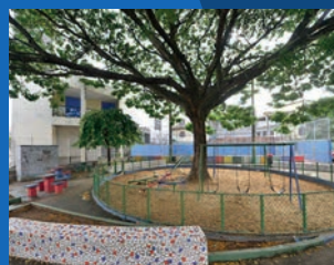
30. Reforma da praça e da quadra da Igreja Católica de São Pedro