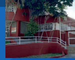
28. Reforma da Emef Neusa Nunes Gonçalves (Em execução)