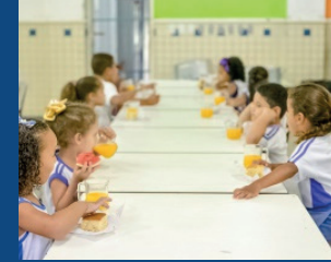
17. Inclusão de mais um lanche na rotina alimentar das escolas