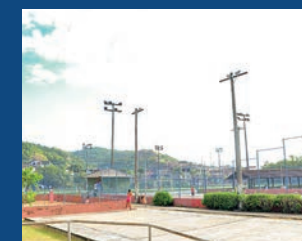
26. Reforma do Parque Baía Noroeste (Concluída)