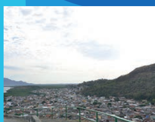
35. Reforma do corrimão do mirante de Santos Reis (Concluída)