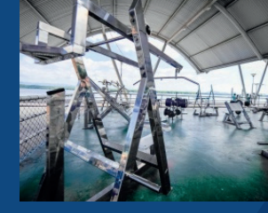
27. Reforma da academia popular e playground da rua 23 de Abril - Santo André (Em execução)