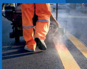
03. Asfaltamento do beco João Rodrigues Costa