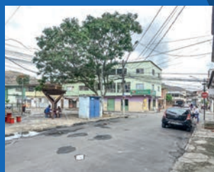
04. Asfaltamento da rua Ministro Rui Barbosa - Santo André