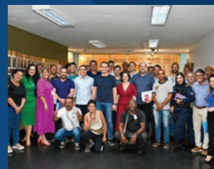
43. Encontro da Regional com a PMV