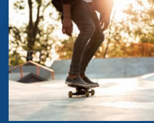
15. Iluminação do Skate Parque de São José