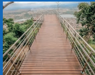
14. Entrega dos 3 mirantes do Parque da Fonte Grande