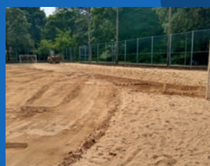
31. Reforma da quadra de Beach Soccer - Nova Palestina (Em execução)