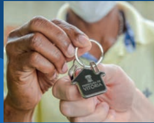
01. Aluguel Provisório (45 famílias beneficiadas)