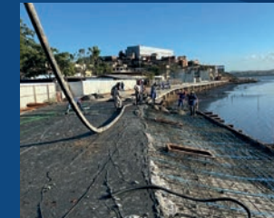
24. Nova Orla de São Pedro (Em execução)