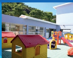
34. Reforma do Cmei Georgina Trindade (Concluída)