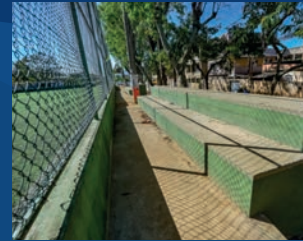
08. Construção das arquibancadas do Campo de Resistência (Concluída)