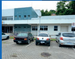
02. Ampliação do horário de funcionamento das US de Conquista/ Nova Palestina (07h às 19h, incluindo finais de semana e feriados)