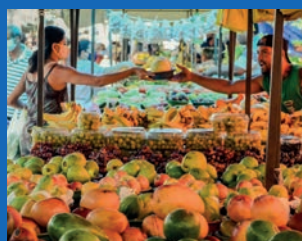
05. Banheiros químicos na feira de Nova Palestina